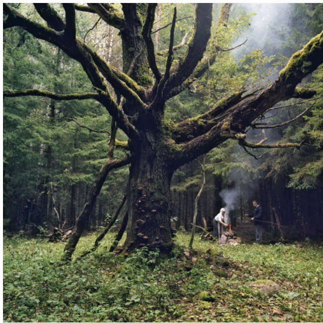
阿尔图罗斯·莱拉 橡树(一)选自系列作品：“地球的力量” 125×125厘米 2005—2012

“立陶宛艺术：透过风景的思考”展集中展示了20世纪至今的立陶宛艺术风貌。1906年，立陶宛开始举办专业美术展览并成立美术家协会，组织展览和推广民族艺术。立陶宛艺术深受西欧文化影响，从古典主义到现代主义，立陶宛艺术家们都有着积极的研究和探索，但他们注重立足本国民族文化的表达，往往将外来文化与本土精神相结合进行创作。从本次展出的作品中亦可见到许多现代主义流派的表现方式，但同时蕴含着鲜明的本土特色。展览分为“画家的视角”、“开放的结构”、“去浪漫主义色彩”以及“绘制风景”四个部分，69件作品涵盖了绘画、雕塑、摄影、物体、装置和影像艺术等多种媒介。这些作品中不乏20世纪初期浪漫主义和现代主义的绘画作品，20世纪中期的表现主义和极简主义绘画、雕塑作品，也有近几十年的新表现主义绘画和当代艺术作品，揭示了20世纪以来立陶宛人民对社会、历史、政治和文化的深度思考。立陶宛历史上曾因政治和军事原因而属于不同国家，尤其在两次世界大战期间，立陶宛曾被德国、苏联几次占领，直到20世纪末才实现独立，后加入联合国。立陶宛与中国这一百多年来社会巨变，发展迅速，都面临着如何处理本土文化与国际风格关系的问题，如何在同质化的国际风格中保持文化特性，如何在当下文化冲击中保持国家传统文化延续不断，并能发展出时代新象。艺术家的思考不仅包含当下世界共同面对的人类问题，也包含自身文化何去何从的问题。立陶宛的博物馆种类和数量较多，他们热爱多彩的生活、热爱传统民间工艺。1933年在维尔纽斯建立的立陶宛艺术博物馆是立陶宛最大的艺术馆，其馆藏分为美术、应用艺术和民俗艺术三类，后两类艺术作品在藏品中占有相当大的比重，如陶瓷、琥珀、玻璃、纺织、家具、木雕、钱币、钟表……立陶宛甚至还有无神论和宗教史博物馆、魔鬼博物馆、种族屠杀受害者博物馆、第九堡垒博物馆等，由此可见立陶宛人民对生活、生命细致敏锐的感受力以及对文化传统强烈的认同感与责任感。这与中国当前对民间艺术的重视、保护非物质文化遗产的立场是一致的，立陶宛在一定意义上可以成为我们审视自己的一面镜子，这应该也是中立两国文化交流的意图所在：同一个世界，相似的处境，我们该如何互鉴互助、携手前行？